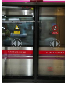
地铁防护门压力分布测试