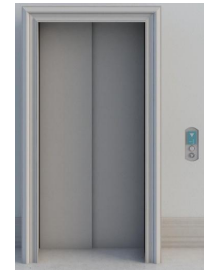
电梯门压力分布测试

Forcemapping-Window 车窗密封压力分布测试系统，使用 0.2mm 薄膜压力分布传感器测量车门与车辆橡胶密封件之间的接触压力分布情况。能够有效帮助解决汽车的漏风，漏水，噪音问题，帮助优化门框周围的密封压力和偏转。